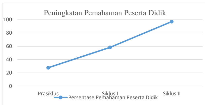
Gambar 2. Perbandingan Hasil Tes Pemahaman Peserta Didik S dan Persentase Ketuntasan Tes Pemahaman Peserta didik Pra Siklus, Siklus 1 dan Siklus II