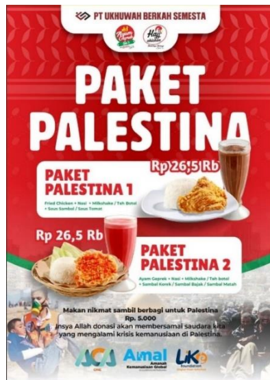
Gambar 1. Contoh gambar Flyer Paket Palestina

Tabel di atas menyajikan rincian menu paket Palestina di seluruh cabang Ayam Geprek Sa'I. Sedangkan harga paket Palestina tidak memiliki harga paten sehingga terdapat perbedaan harga di gerai cabang.