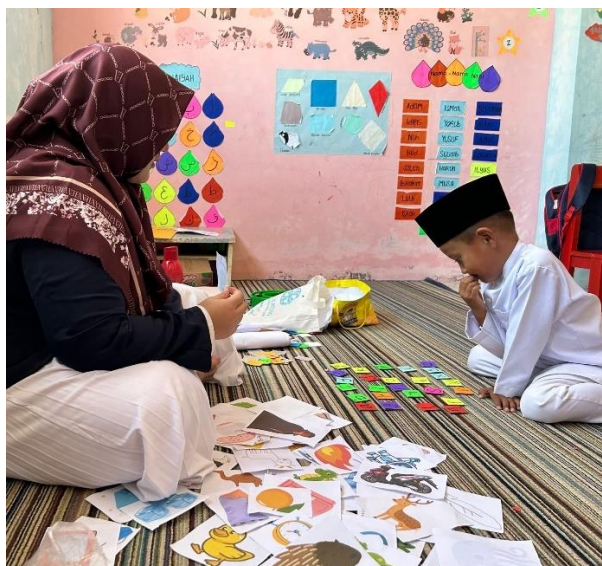
Gambar 2. Peneliti Menerapkan Media Multisensori saat di kelas

Data perkembangan bahasa tulisan awal anak usia dini mengalami peningkatan yang signifikan setelah menerapkan media multisensori dalam siklus II. Hasil tindakan tersebut menunjukkan bahwa tidak ada lagi peserta didik yang belum berkembang (BB), namun hanya terdapat 1 peserta didik yang masih dalam tahap mulai berkembang (MB) dengan persentase 7,7%. Sementara itu, peserta didik yang berkembang sesuai harapan (BSH) berjumlah 8 orang dengan persentase 61,5%, dan peserta didik yang berkembang sangat baik (BSB) berjumlah 4 orang dengan persentase 30,8%.