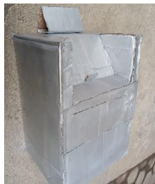
Gambar 5. Tampak samping