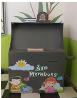
Gambar 7. Tampak depan