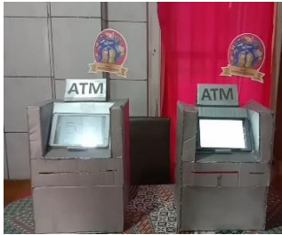
Gambar 4. Tampak depan