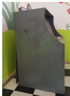
gambar 8. Tampak samping