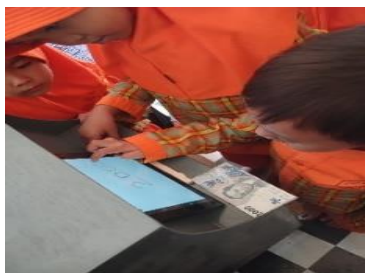
Gambar 3. Foto kegiatan uji coba kelompok besar