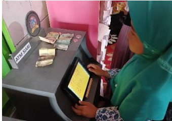
Gambar 2. Foto Kegiatan Uji Coba Kelompok Kecil