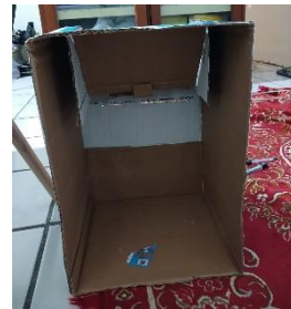
Gambar 6. Tampak belakang