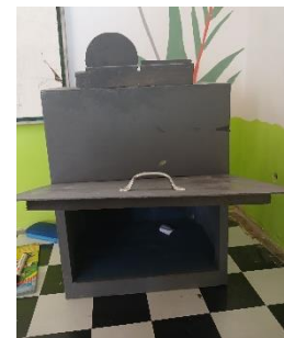
Gambar 9. Tampak belakang