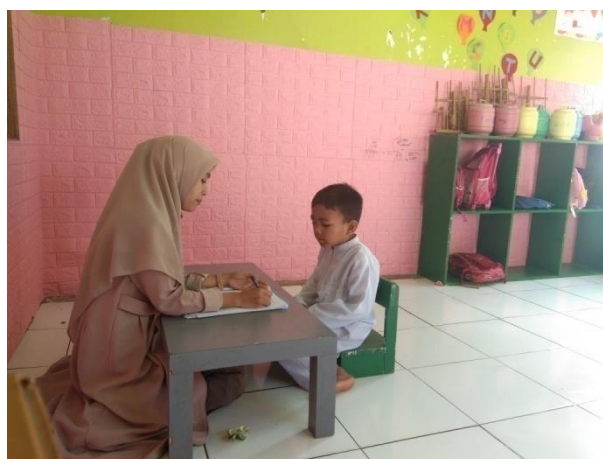
Figure 1Foto Penarikan hafalan dilaksanakan satu persatu

Pada siklus II di minggu keempat ini, rata-rata jumlah surat pendek yang diingat anak mengalami peningkatan yang signifikan.