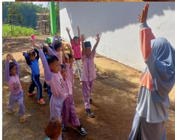
Gambar 3. Peserta Didik Aktif Saat Tanya Jawab Terkait Isi Buku Cerita