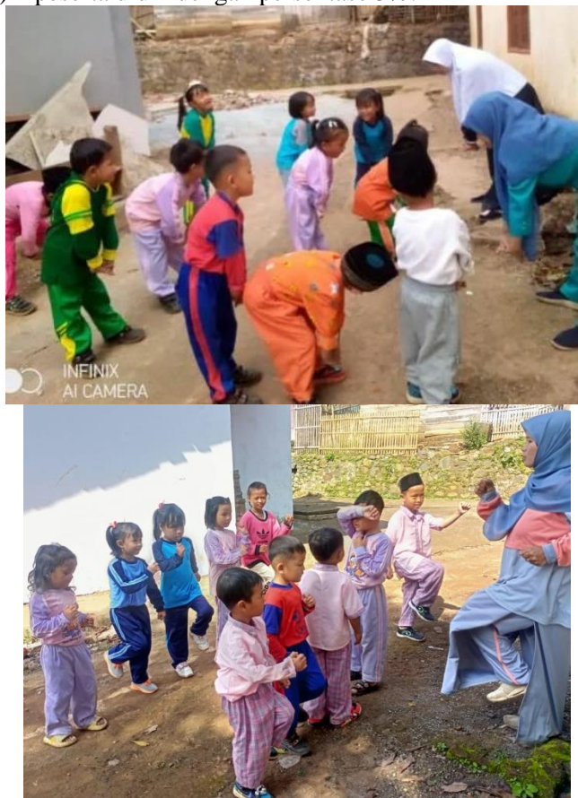
Gambar 2. Peneliti Melakukan Senam Sehat Gembira

Penelitian ini dilakukan dalam dua siklus, setiap siklus ada dua pertemuan. Pada siklus I ini peneliti melakukan penelitian sebanyak dua kali pertemuan, peneliti melakukan senam sehat gembira dengan cara peneliti menyiapkan sound untuk persiapan sebelum senam, mengajak peserta didik untuk berbaris diluar kelas, mengintruksikan untuk tertib dalam berbaris dan peneliti melakukan gerakan senam sehat gembira yang nantinya diikuti oleh peserta didik. Peneliti mengobservasi 20 peserta didik dimana pada siklus I ini peserta didik yang belum berkembang (BB) 2 peserta didik dengan persentase 10%, mulai berkembang (MB) berjumlah 15 peserta didik dengan persentase 75 %, berkembang sesuai harapan (BSH) berjumlah 2 peserta didik dengan persentase 10% dan berkembang sangat baik (BSB) 1 peserta didik dengan persentase 5%.