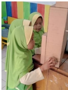
Gambar 2. penerapan media trackball di RA Persis 55 Pangatikan pada siklus I pertemuan ke 2