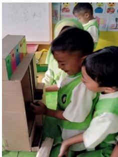
Gambar 1. penerapan media trackball di RA Persis 55 Pangatikan pada siklus I pertemuan ke 1