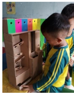
Gambar 3. penerapan media trackball di RA Persis 55 Pangatikan pada siklus II pertemuan ke 1