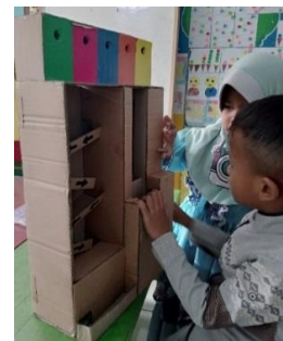
Gambar 4. penerapan media trackball di RA Persis 55 Pangatikan pada siklus II pertemuan ke 2

Sebelum melakukan penelitian tindakan kelas, peneliti melakukan pengamatan awal berupa kegiatan pra siklus untuk mengetahui kondisi terkait kemampuan motorik halus anak. Berdasarkan hasil observasi awal menunjukkan bahwa peningkatan kemampuan motorik halus anak di kelompok A1 RA Persis 55 Pangatikan masih kurang, hal ini dibuktikan dari hasil observasi dimana anak yang belum berkembang sebanyak 5 orang anak atau 50 %, dan yang mulai berkembang sebanyak 3 orang anak atau 30 %, dan