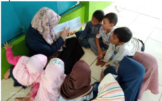
Gambar 2. Peneliti Menerapkan Metode Read-Aloud Saat Bercerita

Penelitian ini dilakukan dalam 3 siklus, setiap siklus ada 3 pertemuan. Pada siklus I ini peneliti melakukan penelitian sebanyak tiga kali pertemuan, peneliti menerapkan metode Read-Aloud dengan cara membaca buku cerita dengan judul “aku suka bersedekah” dengan sub indikator penelitiannya yaitu ketertarikan mendengarkan cerita dengan fokus selama 10-15 menit, mampu menjawab pertanyaan sederhana, mampu mengungkapkan isi pesan moral yang disampaikan peneliti saat membacakan buku cerita, kemampuan membaca dan menulis permulaan dan point terakhir yaitu pelafalan vokal, intonasi dan ekspresi peserta didik. Peneliti mengobservasi 20 peserta didik dimana pada siklus I ini peserta didik yang belum berkembang (BB) 11 peserta didik dengan persentase 55%, mulai berkembang (MB) berjumlah 6 peserta didik dengan persentase 30 %, berkembang sesuai harapan (BSH) berjumlah 2 peserta didik dengan persentase 10% dan berkembang sangat baik (BSB) 1 peserta didik dengan persentase 5%.