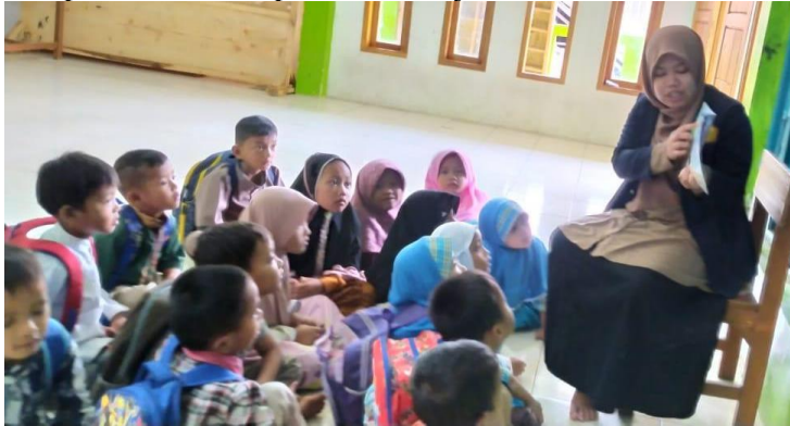
Gambar 3. Peserta Didik Mempertahankan Perhatian Pada Bacaan

Berdasarkan hasil tindakan siklus II diperoleh data perkembangan literasi anak usia dini setelah penerapan Metode Read-Aloud mengalami peningkatan sangat baik namun masih belum mencapai target yang diinginkan peneliti dimana masih ada peserta didik yang Belum Berkembang (BB) sebanyak 3 peserta didik dengan persentase 15 %, Mulai Berkembang (MB) sebanyak 7 peserta didik dengan persentase 35%, Berkembang Sesuai Harapan (BSH) sebanyak 7 Peserta didik dengan persentase 35% dan Berkembang Sangat Baik (BSB) 3 peserta didik dengan persentase 15%. Hasil tersebut belum sesuai dengan targetan peneliti dalam penelitian maka peneliti melanjutkan di siklus ke III.