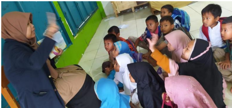
Gambar 4. Peserta Didik Aktif Saat Tanya Jawab Terkait Isi Buku Cerita

Hasil tindakan siklus III diperoleh data bahwa perkembangan literasi setelah penerapan metode Read-aloud di Kober Miftahul Hidayah Bayongbong Garut Mengalami peningkatan yang sangat baik, melihat dari keterangan penilaian sudah tidak ada lagi peserta didik yang Belum Berkembang (BB), yang Mulai Berkembang (MB) berjumlah 2 peserta didik dengan persentase 10 %, Berkembangan Sesuai Harapan (BSH) berjumlah 6 Peserta didik dengan persentase 30% dan Berkembangan Sangat Baik (BSB) berjumlah 12 Peserta didik dengan persentase 60%.