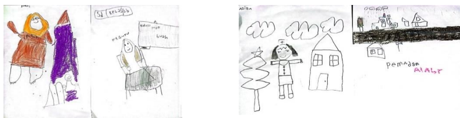
Gambar 5. hasil karya pada siklus ii pertemuan 2 Menggambar cita- cita

Berdasarkan hasil evaluasi yang dilaksanakan dalam kegiatan mengembangkan kecerdasan intrapersonal melalui kegiatan menggambar bebas bertema pada siklus II menunjukkan bahwa semakin meningkatnya kecerdasan intrapersonal pada anak kelas B di RA Ash-Shidiq dari sebelumnya.