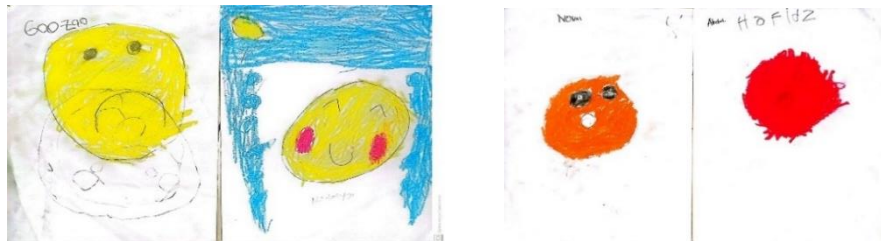
Gambar 2. Hasil Karya Pada Siklus I Pertemuan I Menggambar Bentuk Emosi Yang Dirasakan

Berdasarkan hasil di atas maka dapat disimpulkan bahwa disimpulkan bahwa peningkatan pengembangan kecerdasan intrapersonal sebanyak 0% terdiri dari 0 orang anak yang berkembang sangat baik (BSB), 33% terdiri dari 9 orang anak yang berkembang sesuai harapan (BSH), 56% terdiri dari 15 anak yang mulai berkembang (MB). Dan 11% terdiri dari 3 orang anak yang belum berkembang (BB).