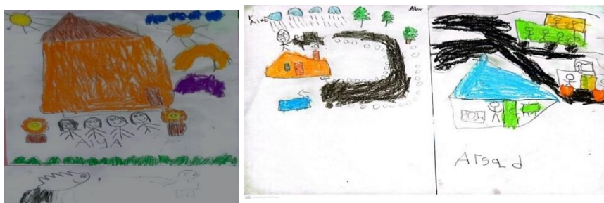
Gambar 4. hasil karya pada siklus 2 pertemuan 1 menggambar jurnal harian

Berdasarkan hasil siklus II pertemuan 1 bahwa peningkatan pengembangan kecerdasan intrapersonal sebanyak 29,4% terdiri dari 8 orang anak yang berkembang sangat baik harapan (BSB), 44,5% terdiri dari 12 orang anak yang berkembang sesuai harapan (BSH). Dan 26% terdiri dari 8 orang anak yang mulai berkembang (MB). Sedangkan yang belum berkembang (BB) adalah 0.