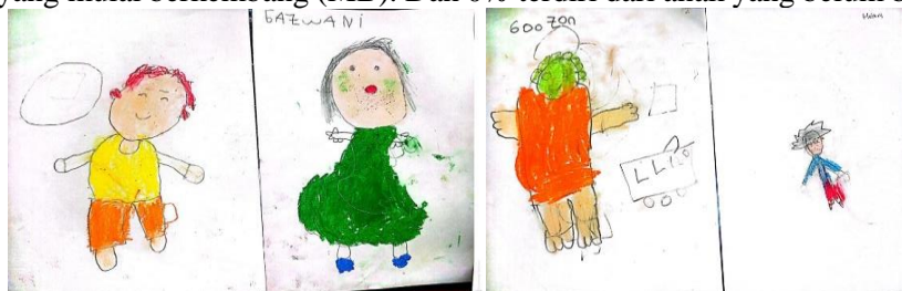
Gambar 3. hasil karya pada siklus 1 pertemuan 2 Menggambar potret diri sendiri

Adapun kendala yang dihadapi dalam pelaksanaan proses tindakan yaitu (1) guru harus menjelaskan lebih jelas terkait tugas yang diberikan kepada anak (2) Guru harus memberikan penguatan terhadap kemampuan anak (3) Sebagian anak masih membutuhkan arahan dalam menggambar (4) Harus adanya kata-kata afirmasi untuk membangun motivasi agar anak bersemangat. Pada pertemuan ini bahwa peningkatan pengembangan kecerdasan intrapersonal sebanyak 7,4% terdiri dari 2 orang anak yang berkembang sangat baik (BSB), 59,1% terdiri dari 14 orang anak yang berkembang sesuai harapan (BSH). Dan 40,7% terdiri dari 11 orang anak yang mulai berkembang (MB). Dan 0% terdiri dari anak yang belum berkembang (BB).