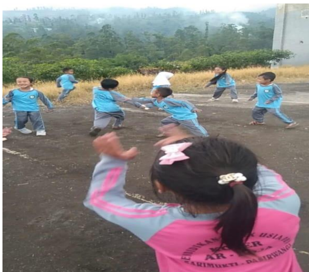
Gambar 2. Dokumentasi kegiatan permainan galah asin kelompok b di kober Ar-Roja

Seperti yang telah disampaikan oleh teori behavioristik tentang belajar adalah perubahan tingkah laku sebagai akibat dari adanya interaksi antara stimulus dan respon. Seseorang dianggap telah belajar sesuatu jika ia dapat menunjukkan perubahan tingkah laku. Sebagai contoh, anak belum bisa berkembang sosial emosionalnya untuk mengenal perasaan diri sendiri dan mengelolanya walaupun gurunya sudah mengajarkannya, namun apabila anak tersebut tidak ada perubahan, maka ia belum dianggap belajar karena ia belum dapat menunjukkan perubahan perilaku sebagai hasil belajar. Sebagaimana teori behavioristik menekankan adanya hubungan antara stimulus dengan respon. Secara umum dapat dikatakan memiliki arti yang penting bagi siswa untuk meraih keberhasilan belajar. Sebagaimana dalam penelitian ini stimulus yang diberikan berupa kesempatan kepada anak untuk bermain bermain di luar ruangan dengan teman sebaya serta membangun hubungan sosial emosional selama permainan berlangsung dan menunjukkan perubahan respon yang diharapkan. (Syarif Anam, Zahara, 2025)